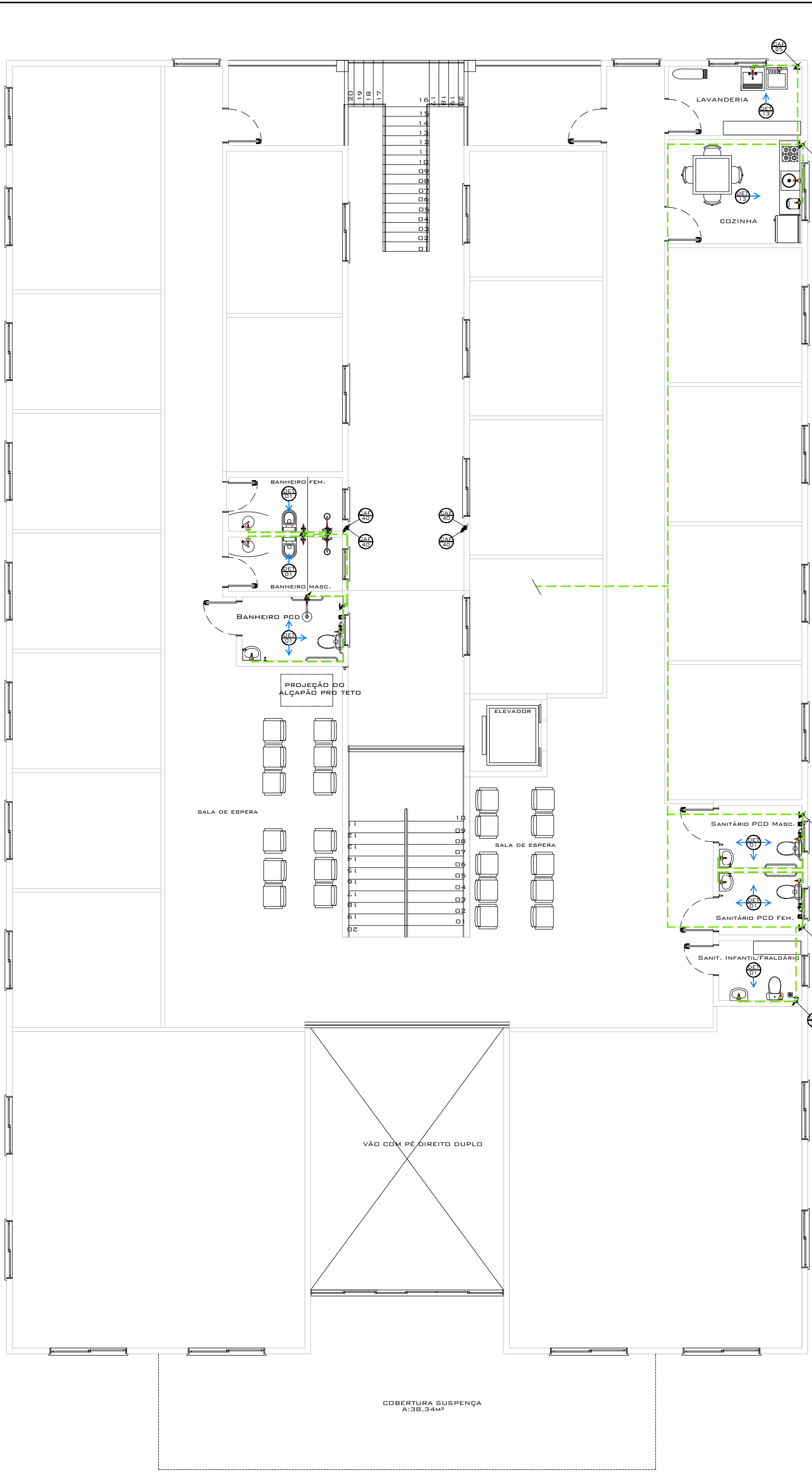
PLANTA BAIXA PAV. SUPERIOR HIDRAULICO ESC.: 1/100